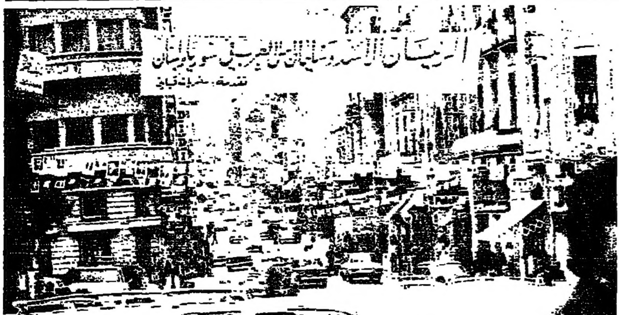
ياقظة كبرى زعمت عند تقاطع شارع المعروض ونوش ترحيباً بالرئيس الأسد، كما ارتفعت صور الرئيس